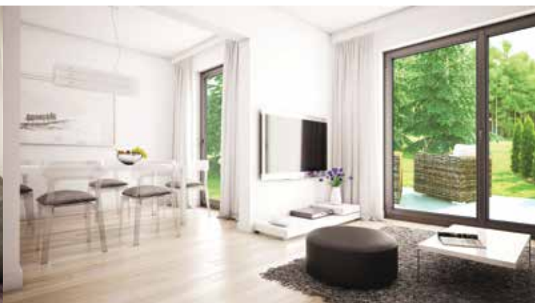
CHABER PRACOWNIA PROJEKTOWA, JUSTYNA MITMAŃSKA-PRYMAS, WWW.CHABER-PROJEKTY.PL